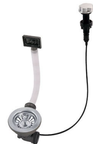
Vidange automatique 8407 000