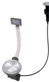
Vidange automatique Space Push - PP 8407 116