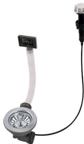
Vidange automatique 8407 100