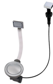
Vidange automatique Space - PA 8407 108